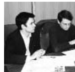
Los arquitectos. | C.B.

"La gran linterna acristalada que emergería sobre la rasante superior de la plaza, establecería un consciente diálogo arquitectónico con la nave del Nuevo Templo, permitiendo a la vez una clara y diáfana